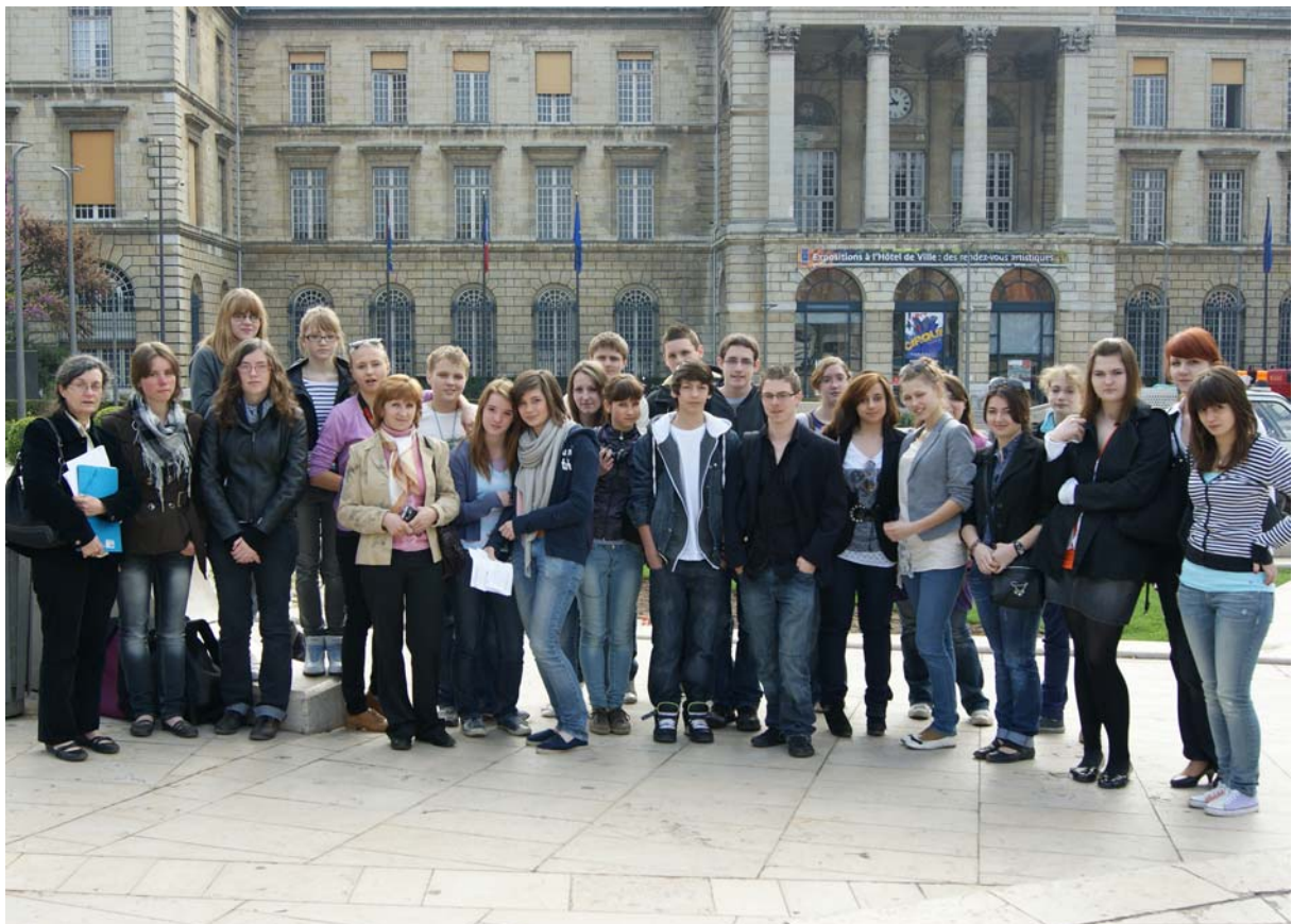
Devant la mairie de Rouen

Le programme d'excursions les a amenés à visiter Rouen, capitale de la Haute-Normandie et ses maisons à colombages