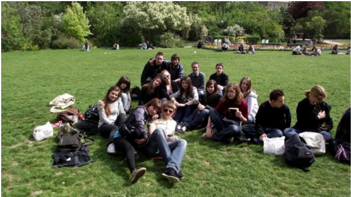
Pique-nique sous la Tour Eiffel

Enfin le 13 avril 2011 , ils ont eu la chance de monter au deuxième étage de la Tour Eiffel, de se promener des Champs Elysées jusqu'au Louvre.