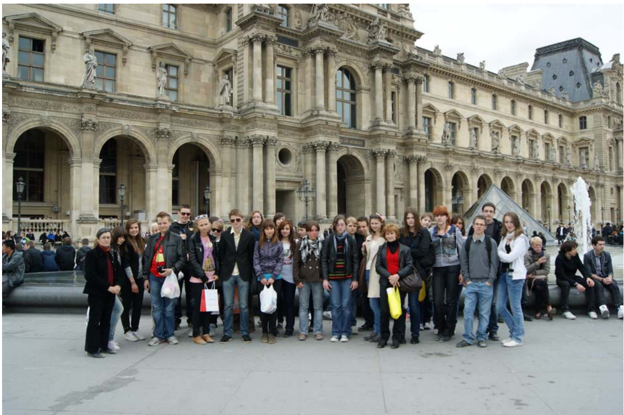
Dans la cour du Louvre.