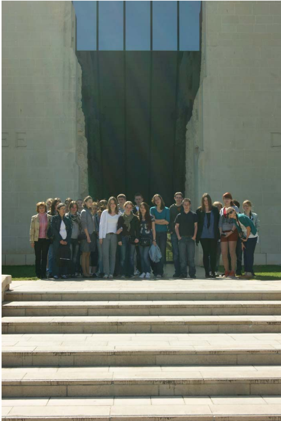
Devant le Mémorial de Caen

Le 10 avril ils ont découvert le Mémorial de Caen et ont été particulièrement intéressés par la section du musée consacrée à la guerre froide, où est racontée l'histoire récente de leur pays, les raisons de la politique de réformes de Gorbatchev, « la perestroïka », la disparition de l'Union soviétique et la naissance de la Russie dans laquelle ils sont nés.